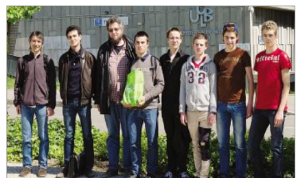
CONGRÈS ANNUEL. Les élèves ont présenté leur projet à Lyon.

Des élèves du lycée Émile-Duclaux participent à l'atelier « Maths en jeans ». Une manière de donner le goût de la recherche et de faire découvrir les mathématiques sous un autre jour.